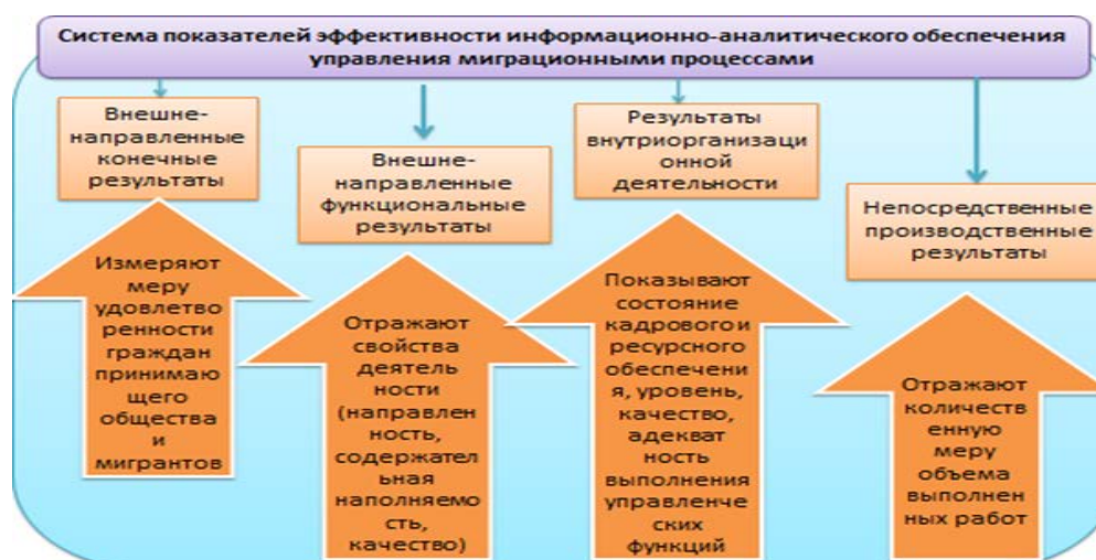
Рисунок 2 – «Дерево» показателей эффективности информационно-аналитического обеспечения в управленческой деятельности миграционной сферы

В фундаменте этой системы должны лежать показатели, отражающие состояние внутриорганизационных параметров (оргструктура, ресурсы, управленческие функции). «Производственные» показатели, отражающие количественную меру объема выполненных работ (выявленных тенденций, проведенных мероприятий и множество других), представляют преимущественно внутриведомственную учетную информацию. Показатели внешненаправленных функциональных результатов отражают свойства деятельности (направленность, содержательная наполняемость, качество), обуславливающие ее соответствие своему объективному назначению, а, следовательно, и конечный социальный эффект, выражаемый в показателях независимого изучения общественного мнения об органах, осуществляющих регулирование миграционных процессов и их функционировании.