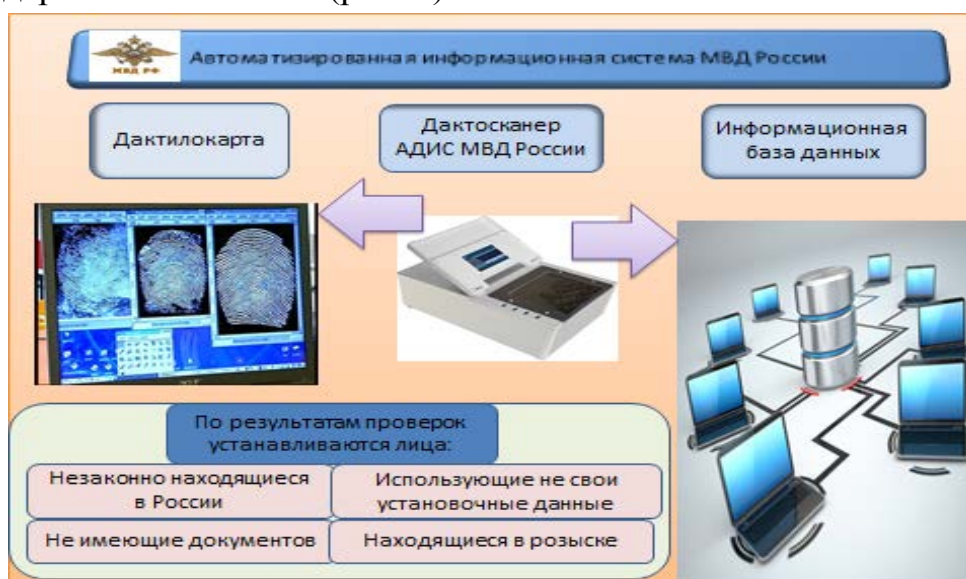
Рисунок 1 – Схема АИС МВД России

Информационно-аналитическое обеспечение стратегических задач в миграционной сфере заключается в сборе значимой информации в масштабах территории обслуживания, стратегическом анализе и прогнозировании развития миграционной обстановки, составлении перечня угроз миграционной безопасности региона, выработке общих рекомендаций для руководства органов государственной власти (рис. 1).