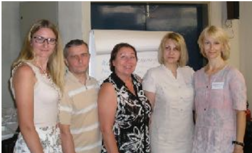
Обмен опытом с коллегами из Белоруссии