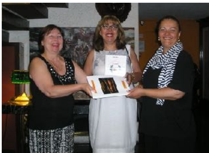
Обмен опытом с коллегами из Грузии