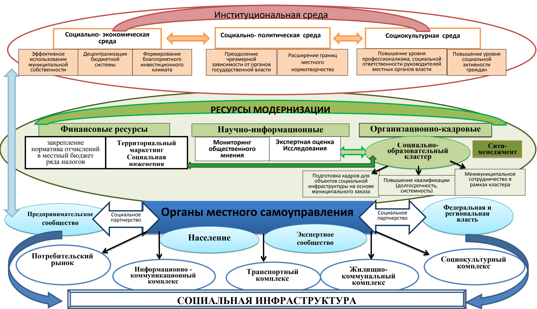
Рис. 2. Модель модернизации социальной инфраструктуры муниципальных образований РФ