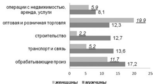
Рис. 1 Структура занятых по видам экономической деятельности и полу в 2015 году, в %

Уверенный рост числа представителей мужской общности последние 8 лет показывает отрасль, связанная с проведением операций с недвижимым имуществом. Нельзя сказать, что в указанных отраслях, женщины как трудовой ресурс не фигурируют, но их численность кратно меньше, чем мужчин (Рисунок 1).